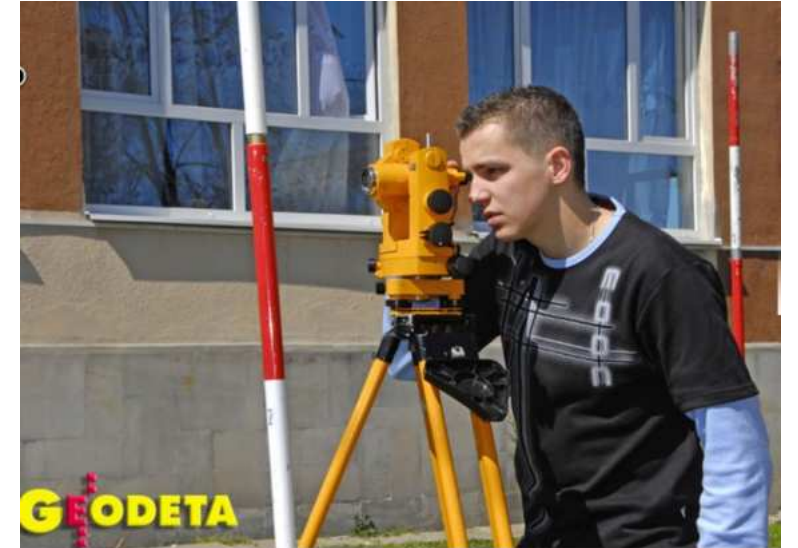
Pomiary w terenie