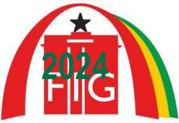
FIG Working Week 2024 19-24 May

Your World, Our World: Resilient Environment and Sustainable Resource Management for All